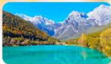
ทะเลสาบไป๋สุยเหอ