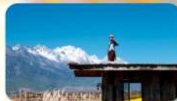
กาแฟ Yun Yi Tang