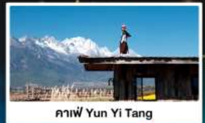
คาเฟ่ Yun Yi Tang