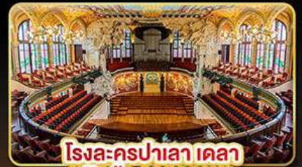
โรงละครปาเลา เดลา มูสิกา คาคาลานา