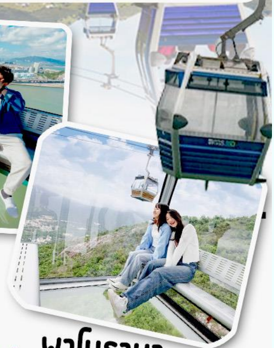
พานิราม่า