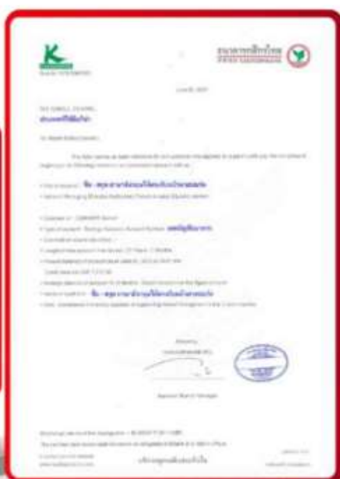
ตัวอย่าง Bank Guarantee ที่ผู้สมัครยื่นขอทำวีซ่า