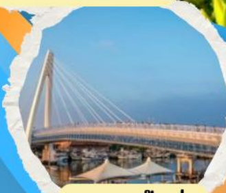
สะพานตงสู่ย