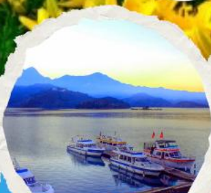
ทะเลสาบสุริยขึ้นจินทารา