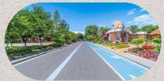
หมู่บ้านโบราณอุยกูร์คาจันจี