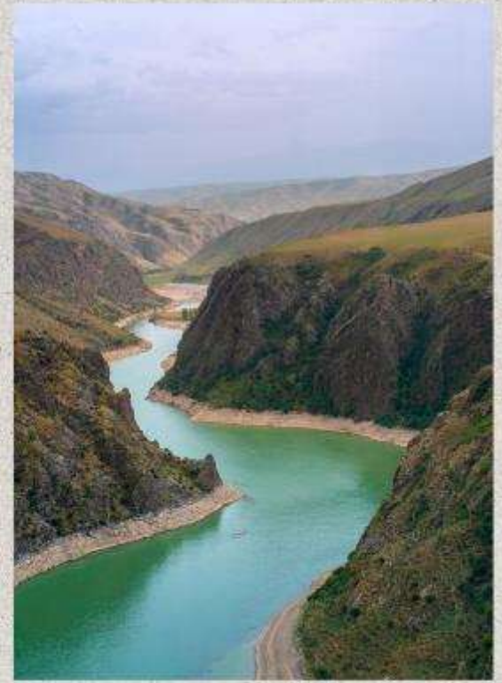
แกรนด์แคนยอนคุโคซู