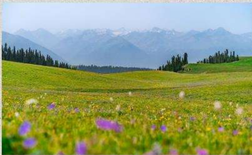
ทุ่งหญ้าคารา