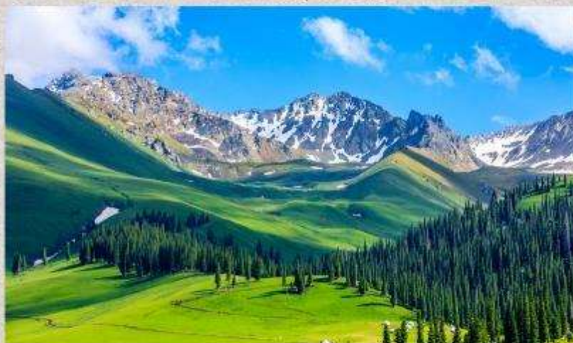
ทุ่งหญ้านาลากี