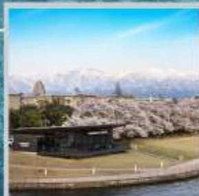
"TOYAMA KANSUI PARK"