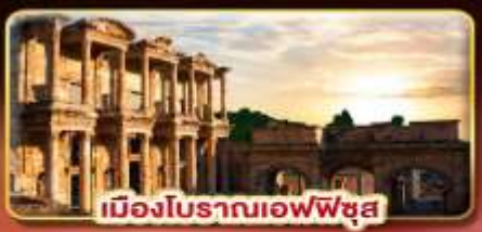
เมืองโบราณเอเฟซุส