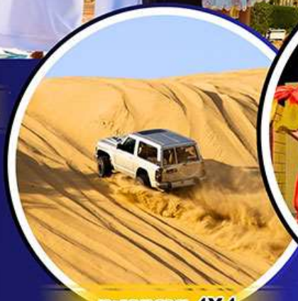
รถเช่าราย 4X4