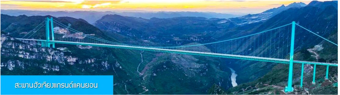
สะพานฮัวเจียงแกรนด์แคนยอน

รับประทานอาหารเช้า ณ ภัตตาคาร (มื้อที่ 7)