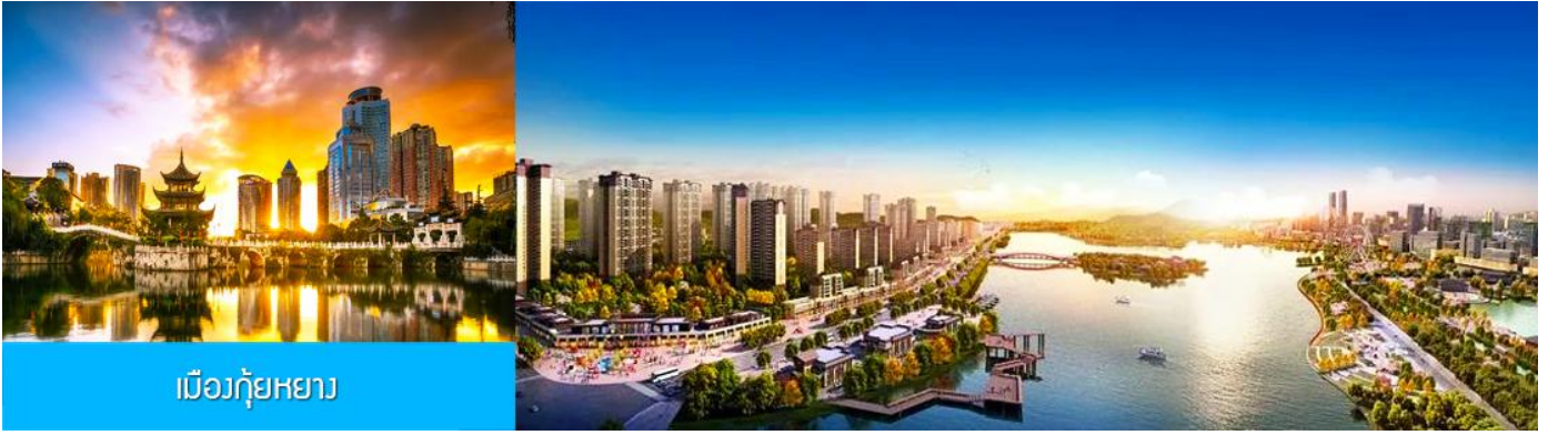
เมืองกู่หยาง