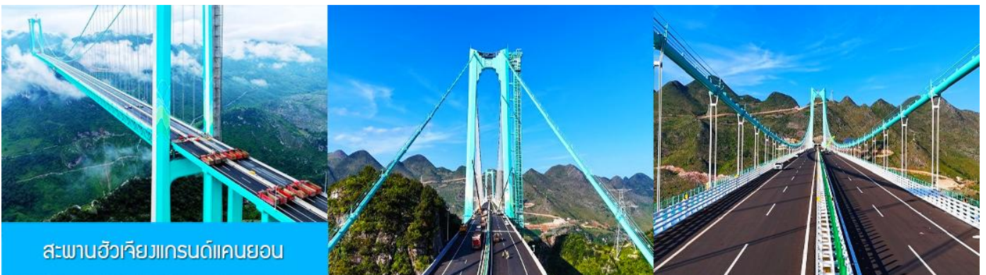
สะพานฮัวเจียงแกรนด์แคนยอน