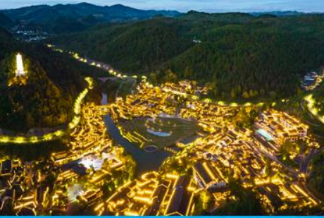
เมืองโบราณวูเจียงจ้าย