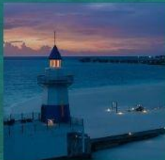
Light House Restaurant